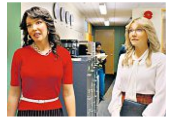
Star und Mauerblümchen: Tully (links) und Kate.

Ihre Gesichter kennen alle, die in den letzten zwanzig Jahren regelmässig Serien geschaut haben. Beide schafften ihren Durchbruch in den Nullerjahren mit Rollen als Ärztinnen in Kultserien: Sarah Chalke (45) mit «Scrubs – Die Anfänger», Katherine Heigl (42) mit «Grey's Anato-